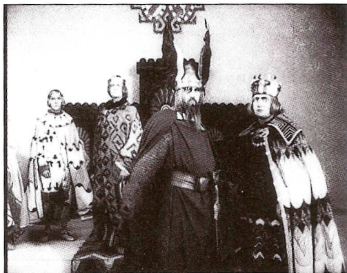
Fotograma de la película Los Nibelungos